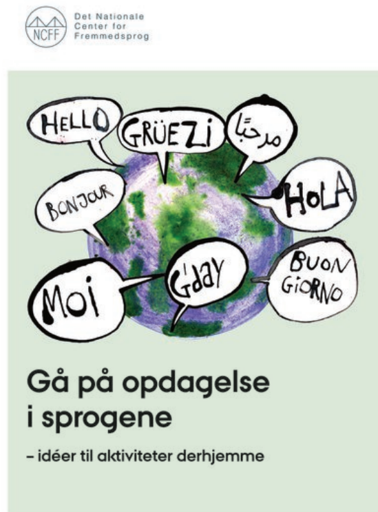
Figur 2: Download hæftet:

Som skole eller lærer, kan I enten sende hele dokumentet ud eller plukke enkelte aktiviteter ud.