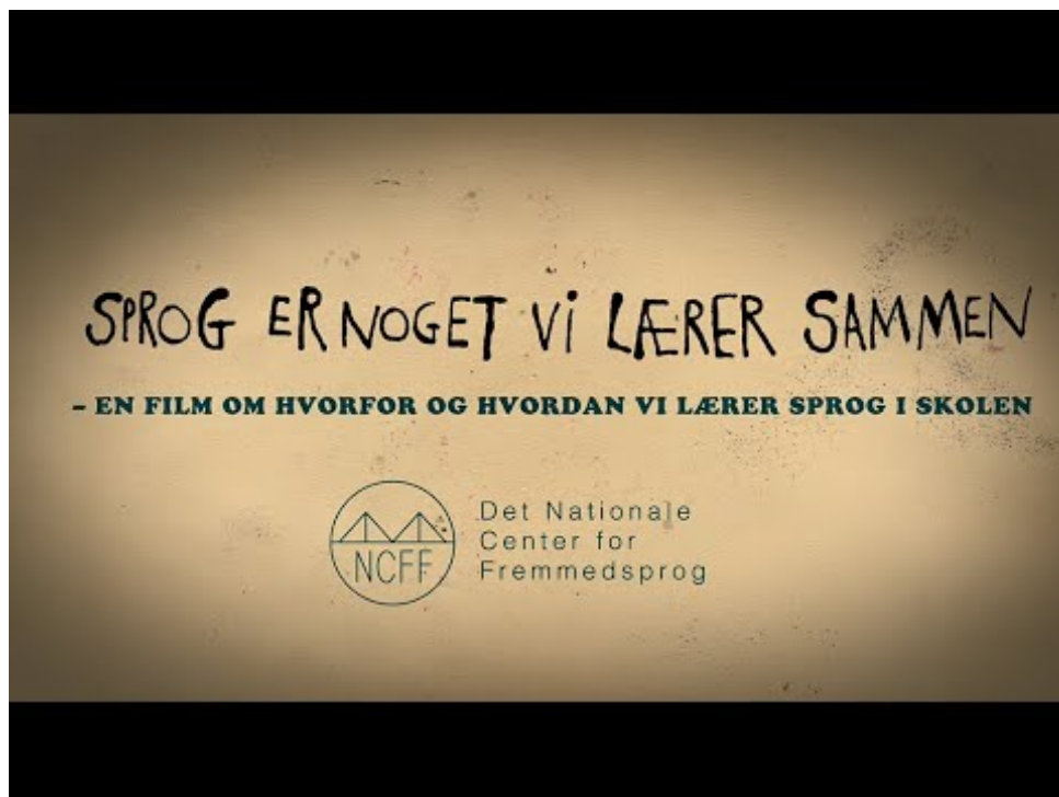
Figur 1: https://youtu.be/gZRuvSuLPNk

Filmen Sprog er noget vi lærer sammen handler om, hvorfor og hvordan vi lærer sprog i grundskolen. Den sætter samtidig fokus på flersprogethed og det kommunikative, funktionelle sprogsyn. Den henvender sig til både elever og forældre og kan fx vises på et forældremøde eller sendes ud via AULA.